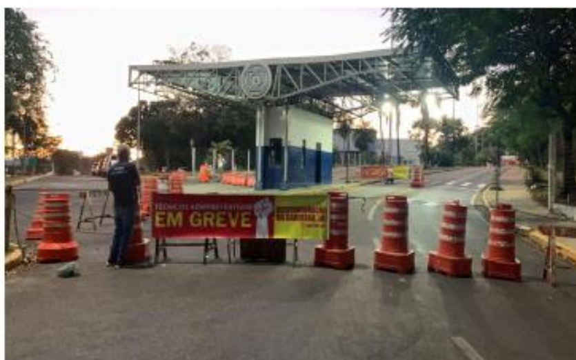
(Fechamento da Guarita 1 da UFMT de madrugada)

No campus Barra do Garças, no interior do estado de Mato-Grosso, também houve ato unificado com as entidades.