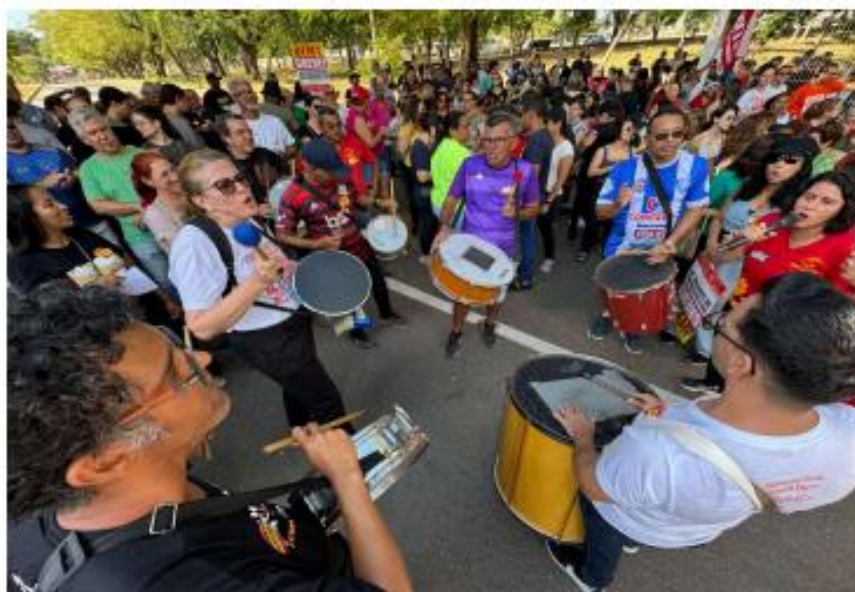
(Concentração do Ato)