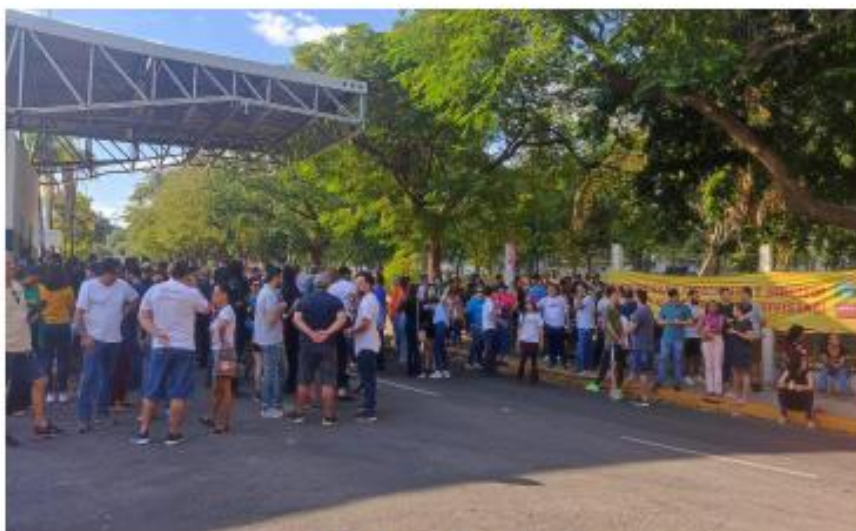
(Concentração do Ato)