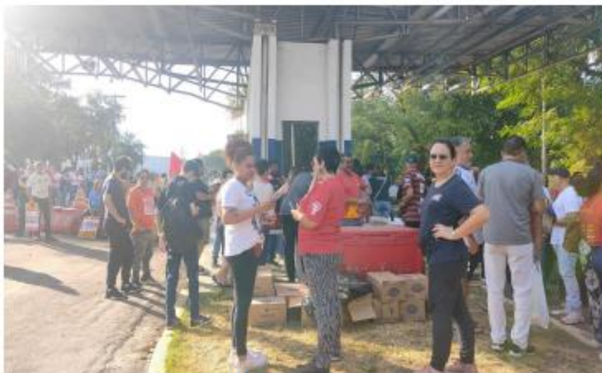
(Concentração do Ato)