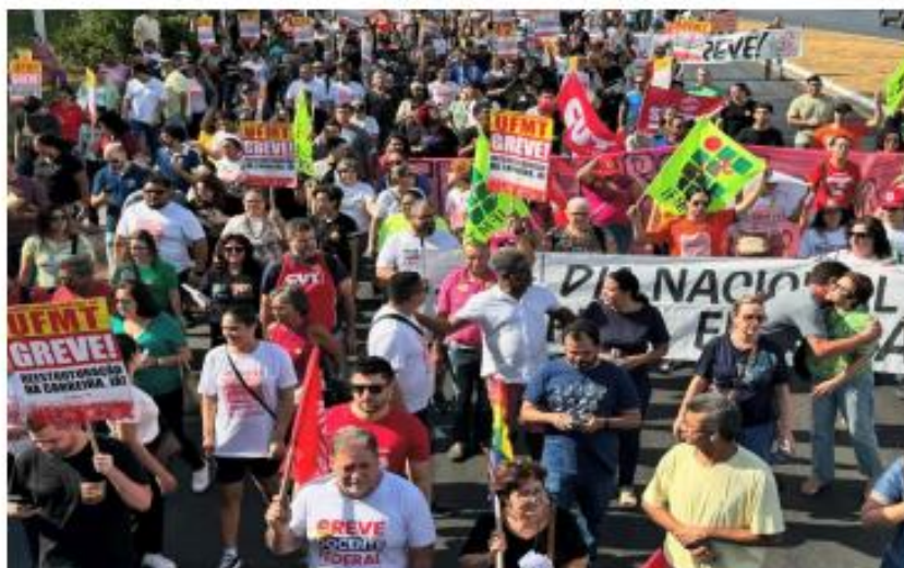
(Ato de rua)