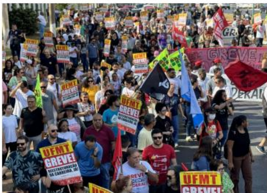
(Ato de rua)