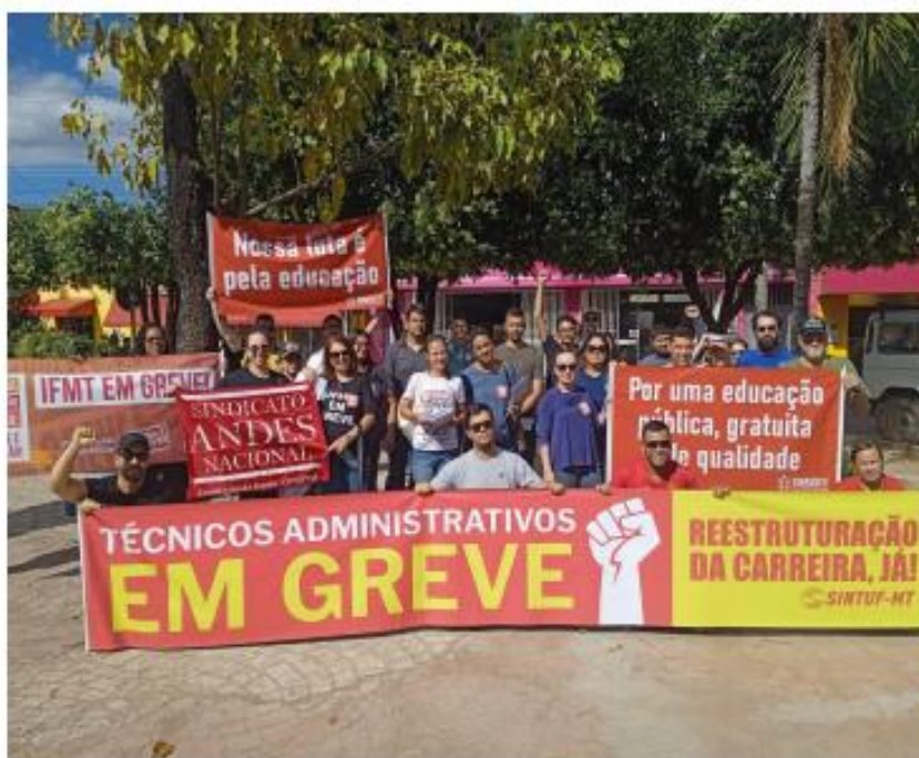
(Ato no Campus de Barra do Garças)